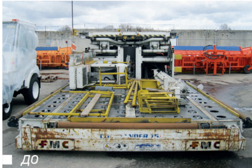
■ ПЕРЕГРУЖАТЕЛЬ КОНТЕЙНЕРОВ FMC COMMANDER 151